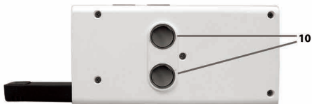
SUPERTOOTH LIGHT (Rückansicht)